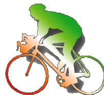
TABELLA DI MARCIA